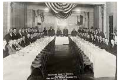
Cena de graduados del Curso de seguridad industrial dictado por el Consejo de Seguridad de Delaware. 22 de mayo de 1922

El Consejo de Seguridad de Delaware también ha estado muy implicado en la mejora de la seguridad escolar. En colaboración con el Departamento de Educación Pública del Estado, el Departamento de Carreteras del Estado y la Policía Estatal de Delaware, el Consejo de Seguridad de Delaware estableció en 1935 el actual curso formal de educación vial para todas las escuelas públicas. El programa se amplió en 1953 para incluir las escuelas privadas y de nuevo en 1957 para incluir las escuelas parroquiales. Asimismo, el Consejo participó en la presentación del programa de Formación de Conductores de Autobuses Escolares en todo el estado y en el desarrollo y distribución del programa de Patrullas de Seguridad Escolar que aún se mantiene activo. En los años siguientes, el Consejo de Seguridad de Delaware se expandió e introdujo sus propios cursos y