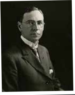
Irénée du Pont

Fundado en 1919 por la presidenta de la empresa DuPont, Irénée du Pont, el Consejo de Seguridad de Delaware se creó con la misión de brindar formación y recursos en materia de seguridad a la industria y, posteriormente, amplió su alcance para incluir la seguridad pública y escolar.