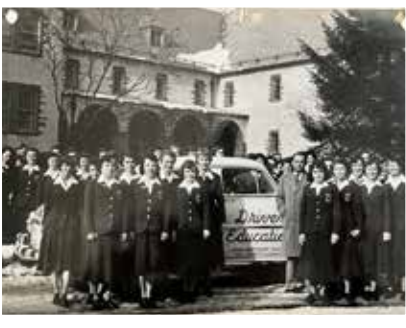
Capacitación para conductores del Consejo de Seguridad de Delaware. 1946, Ursuline Academy