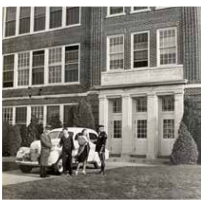
Capacitación para conductores del Consejo de Seguridad de Delaware. 1940, Milford High School

programas educativos de seguridad. En 1967, se introdujo el ampliamente conocido programa de Conducción Defensiva. En 2004, se creó una versión en línea. Al entrar en el nuevo milenio, el Consejo creó nuevas ofertas de cursos para la comunidad y el lugar de trabajo.