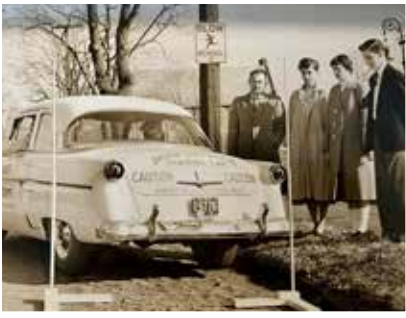
Capacitación para conductores del Consejo de Seguridad de Delaware. 1954, Wilmington Friends School